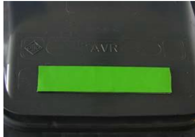
Grünes Klettband auf Abfallbehälter (Bild 4)

Nur wenn das grüne Markierungsband angebracht ist, wird Ihr Abfallbehälter am Abfuhrtag geleert.