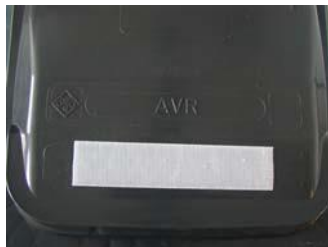
Weißes Klettband auf Abfallbehälter (Bild 3)

Die weiße Klettseite wird auf den Deckel Ihres Abfallbehälters geklebt (Bild 3) und bleibt dauerhaft auf Ihrer Tonne. Ist am Abfuhrtag nur die weiße Klettseite zu sehen, wird die Tonne an diesem Tag nicht geleert. Ist das weiße Klettband nicht an der Tonne befestigt, ist für unser Servicepersonal nicht eindeutig zu erkennen, ob Ihre Tonne geleert werden soll oder nicht. In diesem Fall können unerwünschte Leerungen und damit unnötige Kosten entstehen. Kleben Sie daher bitte unbedingt das weiße Klettband auf den Deckel Ihrer Tonne.