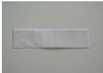
Weiße Klettseite (Bild 1)

Das grüne Band besteht aus einer selbstklebenden weißen Klettseite (Bild 1) und dem dazugehörigen grünen Markierungsband (Bild 2).