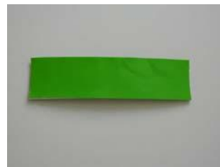
Grünes Markierungsband (Bild 2)